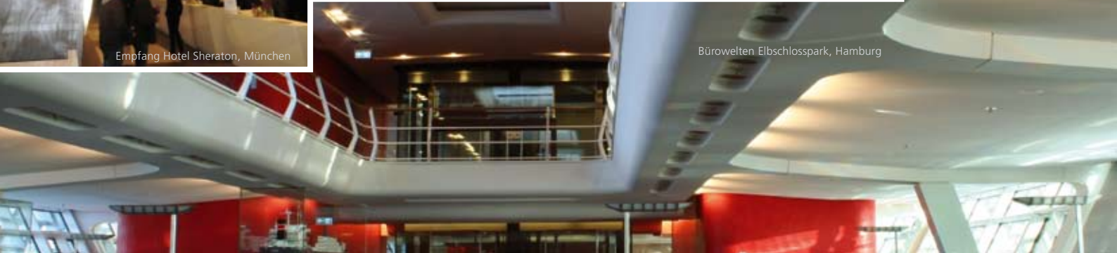
Bürowelten Elbschlosspark, Hamburg