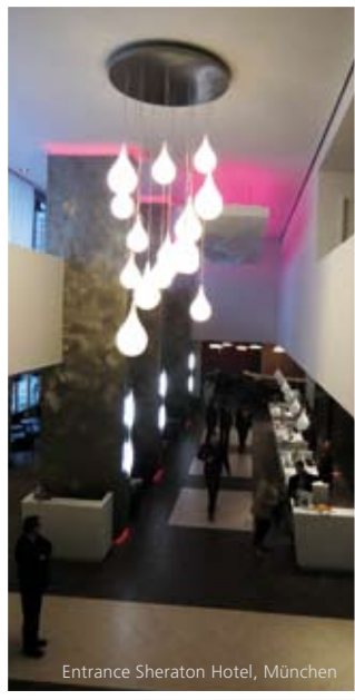
Entrance Sheraton Hotel, München