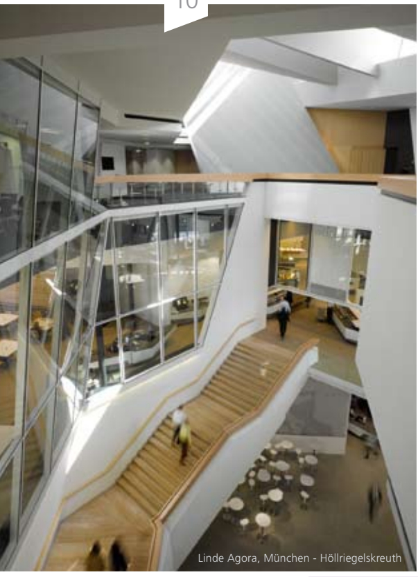
Linde Agora, München - Höllriegelskreuth