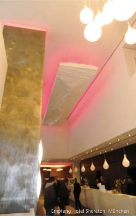
Empfang Hotel Sheraton, München