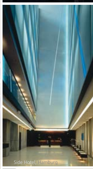
Side Hotel, Hamburg