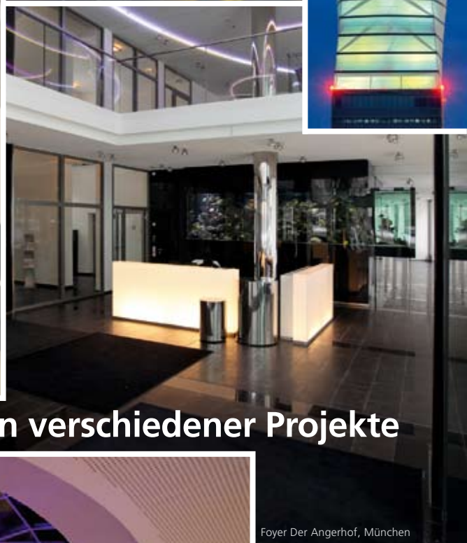
Foyer Der Angerhof, München